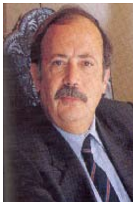
António Borges, António Vitorino e Carlos Monjardino

Esquerda Socialista, ingressando mais tarde no Partido Socialista. Fez a sua carreira profissional na advocacia, sendo sócio da firma de advogados Morais Leitão, Galvão Teles, Soares da Silva & Associados, que exerce actividade, designadamente, nas áreas de direito administrativo, bancário e financeiro, mercado de capitais, concorrência e direito comunitário, ambiente, energia, fusões e aquisições, privatizações e imobiliário.