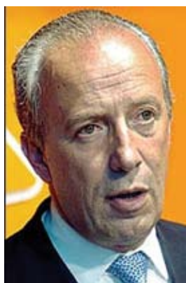
António Guterres, Ferro Rodrigues e Santana Lopes

licos: em Cabril, Cerveirences de Espiga, que fazem parte do projecto eólico do Vale do Minho, e ainda na serra da Nogueira.