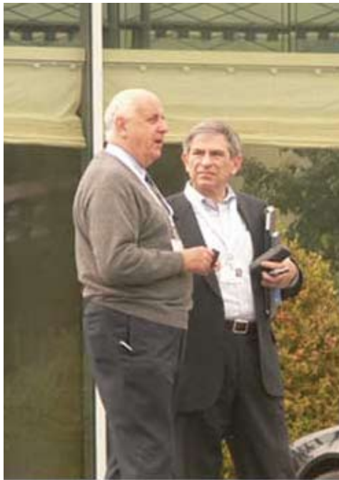
Etienne Davignon e Paul Wolfowitz (em cima) e Rainha Beatriz da Holanda (em baixo), em 2003.

O príncipe Bernhard contratou também um exército de mercenários, na sua maioria britânicos, para combater o tráfico de marfim em reservas selvagens no continente africano. Todavia, essa organização participava no tráfico e estava ao serviço da manutenção do apartheid na África do