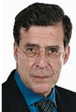
Marcelo Rebelo de Sousa, Oliveira Martins e Vasco Graça Moura

cional revelou-se muito gratificante para impulsionar a governação corporativa. O grupo Bilderberg estabelece, de resto, uma estratégia de governação mundial na perspectiva dos interesses dos grupos económicos e corporações de empresas transnacionais. O caminho para Bilderberg tem muitas vias. Uma vez chegam lá por via política outras pela via da governação corporativa. Em todo o caso, é um caminho geralmente percorrido nos dois sentidos.