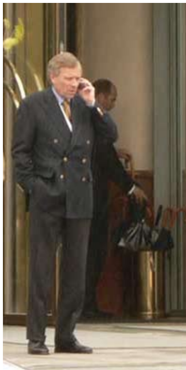
Jaap Hoop Scheffer e Henry Kissinger

Além do Council on Foreign Relations, do Royal Institute of International Affairs e do grupo Bilderberg, foram ainda criados The American Association for the United Nations (em 1943 e que deu origem à The United Nations Association), Clube de Roma (1968) e Comissão Trilateral (1973). A The American Association for the United Nations foi constituída por um grupo de proeminentes cidadãos norte-americanos, a que