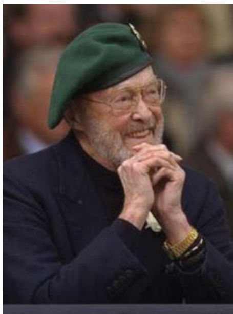
David Rockefeller e Príncipe Bernhard

mínimo» converteu-se na ideologia de governantes e corporações.