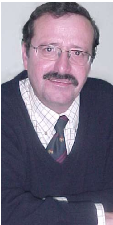
Por PAULO TRINDADE

Não é por acaso que de forma espontânea a adjectiva-