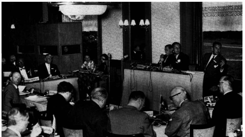
Primeira conferência, em 1954

Embora insistisse que essa participação se fazia a título pessoal, Jacques Santer, que presidia à Comissão, reconheceu em 1999