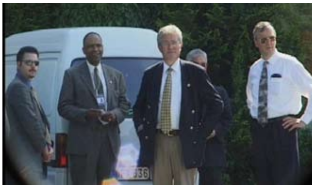
CIA, segurança à conferência de 2000