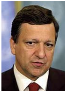
Pinto Balsemão, José Sócrates e Durão Barroso

peia indiciam uma maior aproximação dos dirigentes políticos portugueses dos grupos e organizações do capitalismo transnacional.